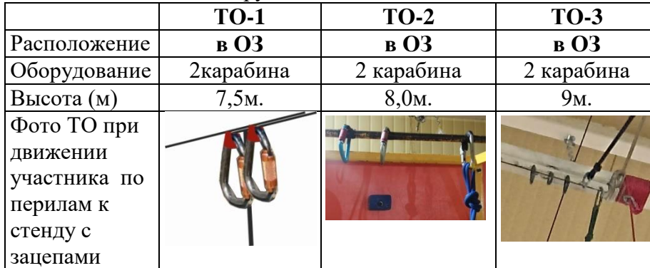
Схема дистанции. Расположение ТО, ВСВ и БЗ.

14. Расположение, оборудование и высота ТО: