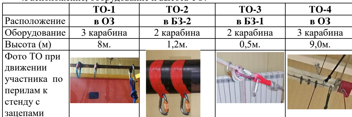
Схема дистанции. Расположение ТО, ВСВ и БЗ.

4. Расположение, оборудование и высота ТО: