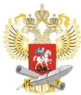
Министерство образования и науки Российской Федерации